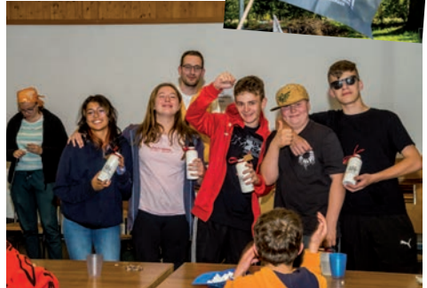
Gruppe Black Pearl

Samstag Früh am Morgen trafen wir uns alle gut gelaunt am Bahnhof Horgen. Nachdem wird das Gepäck verladen hatten, warteten wir auf den Zug Richtung St. Gallen. In Altstätten angekommen, ging es direkt mit dem ersten Postenmarsch in Richtung Eichberg los. Die Posten waren sportlich sowie auch kreativ. Am Ende des Postenmarsches kamen wir beim Lagerhaus an, wo wir von unserem Piraten Captain empfangen wurden. Er zeigte uns unser Lagerhaus und wir bezogen sofort unsere Zimmer. Damit wir alle Piraten an Bord kennenlernen konnten gab es eine Vorstellungsrunde. Wir lebten uns alle schnell ein. Nach diesem anstrengenden, aber tollen Tag gingen wir zu Bett und freuten uns schon auf den nächsten Tag.