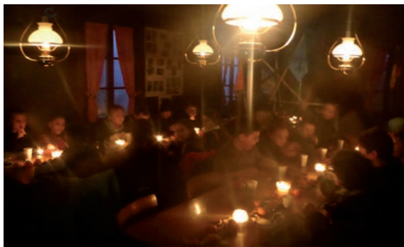
Sportkadetten – Besuch vom Samichlaus