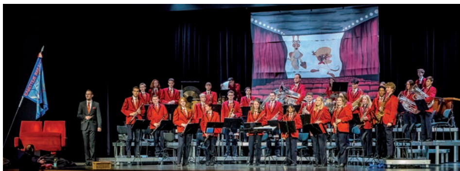
Musikkadetten – Kadettefäscht 2021