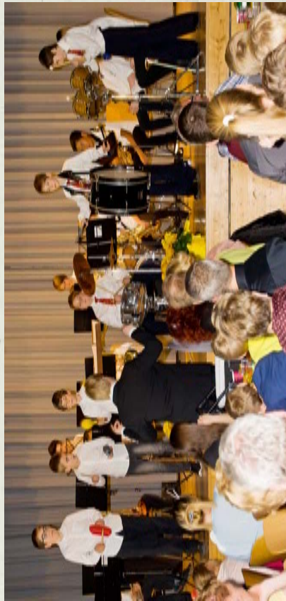
Die jungen Rhythmliker der Kadettenmusik Horgen wussten zu gefallen.